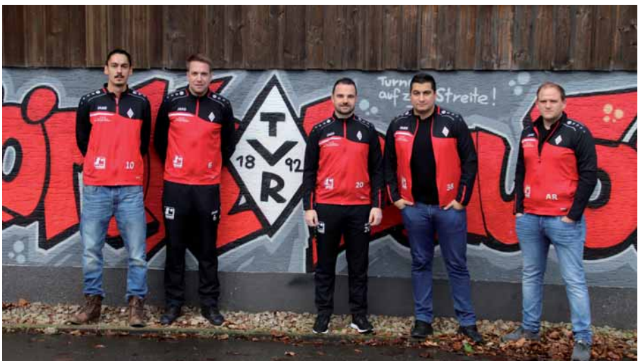
Trainer Senioren 2020-2021